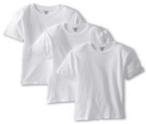
Camiseta blanca (cuello redondo)

La administración de OMI decide si el aspecto de los candidatos sigue los estándares de la academia.