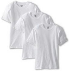
White Crew Neck T-Shirt (no designs or logos) tucked in