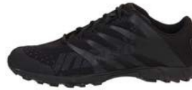
Black Athletic Shoes