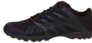
Zapatos atléticos (negros)