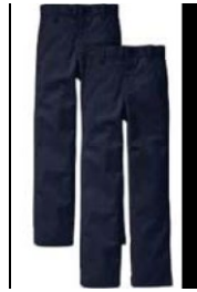
Pantalones de Chadal Negros